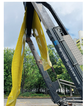
SHZ-Hebeband beim Einbringen eines Glasfaserliners in ein Kanalrohr